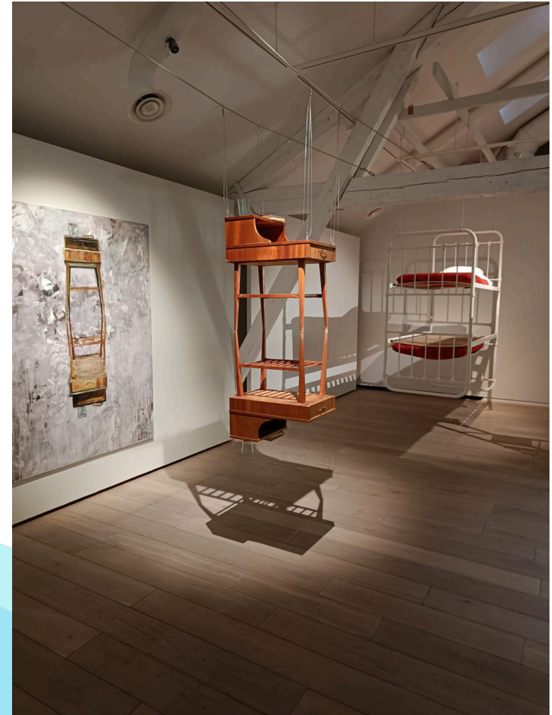
Kunsti museum för modern konst, Meta Isæus-Berlin, Arkadias speglar .

Duchampin nimi on mainittu myös puhuttaessa Isæus-Berlinin taiteesta. Isæus-Berlinin teokset ovat nykytaidetta. Näyttelyn monissa teoksissa on tuttuja elementtejä ja esineitä, jotka liittyvät jokapäiväiseen elämään. Miltei jokaisella Suomessa asuvalla on paikka, jossa nukkua, syödä ja viettää aikaa, minne voi mennä koulun tai töiden jälkeen. Osa kutsuu tällaista tilaa kodiksi. Kotiin liittyvät asiat voivat herättää ajatuksia, esimerkiksi tuoli muistuttaa äidistä, jos se oli ennen äidin keittiössä, vesi saattaa tuoda mieleen lämpimän kylvyn tai pelon, jos veden äärellä on tapahtunut jokin onnettomuus. Sigmund Freud tarkoitti käsitteellä Unheimlich (engl. uncanny) kokemusta, joka koostuu toisensa poissulkevista elementeistä ja jossa tavallinen ja kotoinen muuttuu pelottavaksi ja kammottavaksi. Onko sinulla asioita, jota pelkääät niihin liittyvän muiston tai tapahtuman vuoksi tai mitä ylipäätään pelkääät?