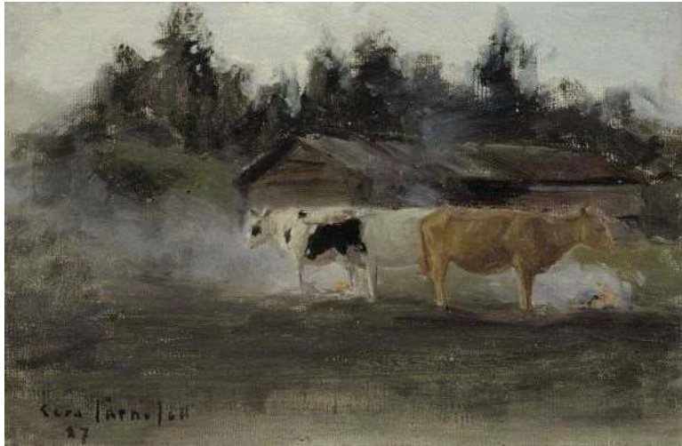
Lehmisavu, harjoitelma , 1887, öljy kankaalle, 19 cm x 29 m, Ateneumin taidemuseo, Hörhammer

ks. https://www.kansallisgalleria.fi/fi/galleries/21j0f4