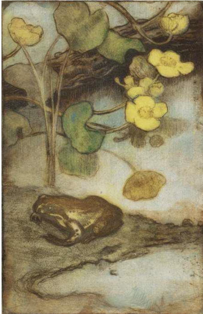
Rentukka ja sammakko , ajoittamaton, pehmeäpohjasyövytys, 43,5 cm x 30 cm, Ateneumin taidemuseo