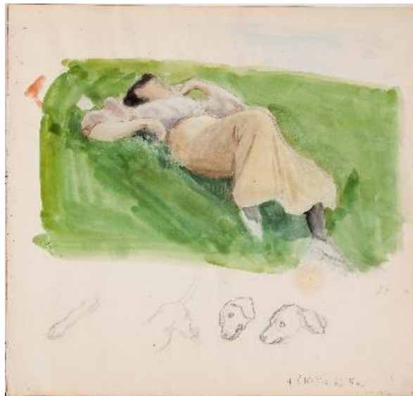
Luonnos teokseen Saimi kedolla, sivu Järnefeltin luonnoskirjasta , 1890 – 1919

Keksitkö, miltä lehmiä suojellaan polttamalla niiden lähellä pientä nuotiota? Oletko sinä kohdannut lehmän - missä?