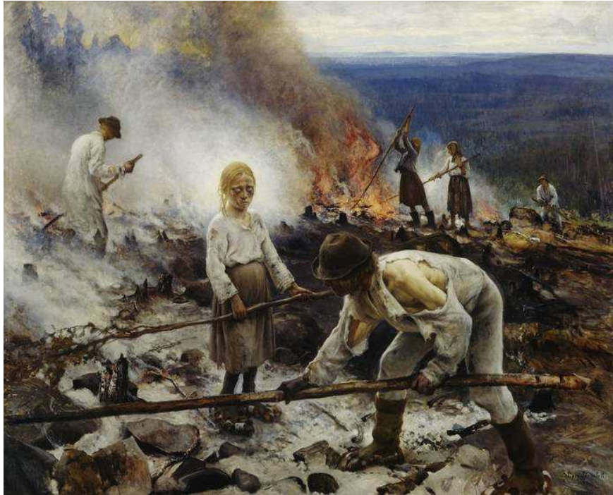
Raatajat rahanalaiset / Kaski , 1893, öljy kankaalle, 131 cm x 164 cm, Ateneumin taidemuseo, Antell