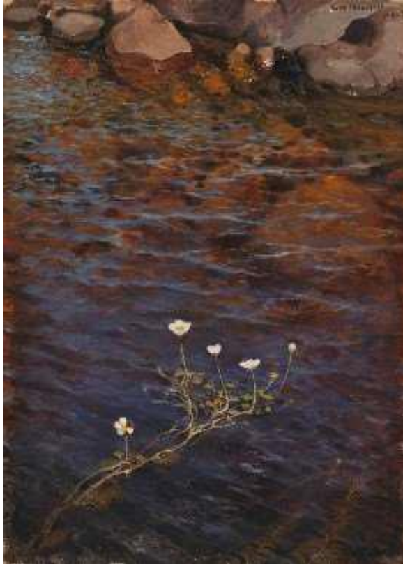
Vesileinikki ja rantakivet, 1895, öljy kankaalle, 39 cm x 28 cm, Ateneumin taidemuseo

Eero Järnefelt oli taitava pelkistämään aiheensa. Näin hän pyrki tuomaan ilmi luonnossa kokemansa tunteen tai kohteensa ominaisluonteen. Hän käytti usein hienovaraista, runolliseksi luonnehdittua väriasteikkoa ja selkeitä väripintoja.