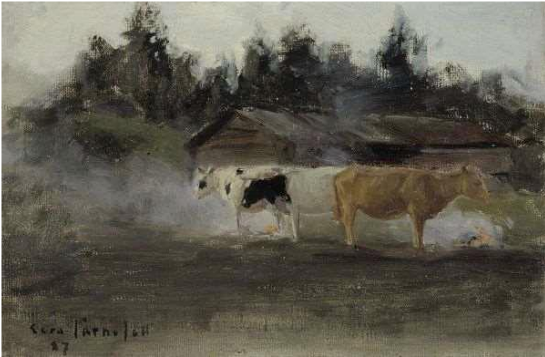
Lehmisavu, harjoitelma , 1887, öljy kankaalle, 19 cm x 29 m, Ateneumin taidemuseo, Hörhammer (Näyttelyssä esillä on toinen versio Lehmisavu-teoksesta)

Eero Järnefeltillä oli jo varhaisvuosinaan paljon kokemusta Suomen luonnossa liikkumisesta ja luonnon havainnoinnista. Omaksi koettu luonto vaikutti hänen mukaansa ihmiseen syvällisimmin. Siksi luonnon tuli olla taiteilijan pääasiallinen kuvaamisen kohde. "Tehdä vähän, mutta hyvin, tehdä niin kuin parhaiten tuntee, eikä ajatella suurenmoisuutta" , kuten hän itse totesi.