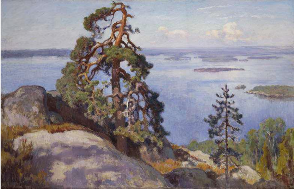
Maisema Koliilta , 1928, öljy kankaalle, 125,5 cm x 196 cm, Ateneumin taidemuseo, Suomen Säästöpankki Oy

Pohjois-Karjalan Koli oli Eero Järnefeltille vuosikymmeniä kestänyt haltioitumisen aihe ja hän halusi yhä uudestaan kokea, millaisen ”... vaikutuksen se nyt minuun tekee ”. Häntä viehättivät järvinäkymät, joissa näki kauas. Hän tutki maiseman valoja ja varjoja sekä näkymiä ylhäältä ja alhaalta käsin.