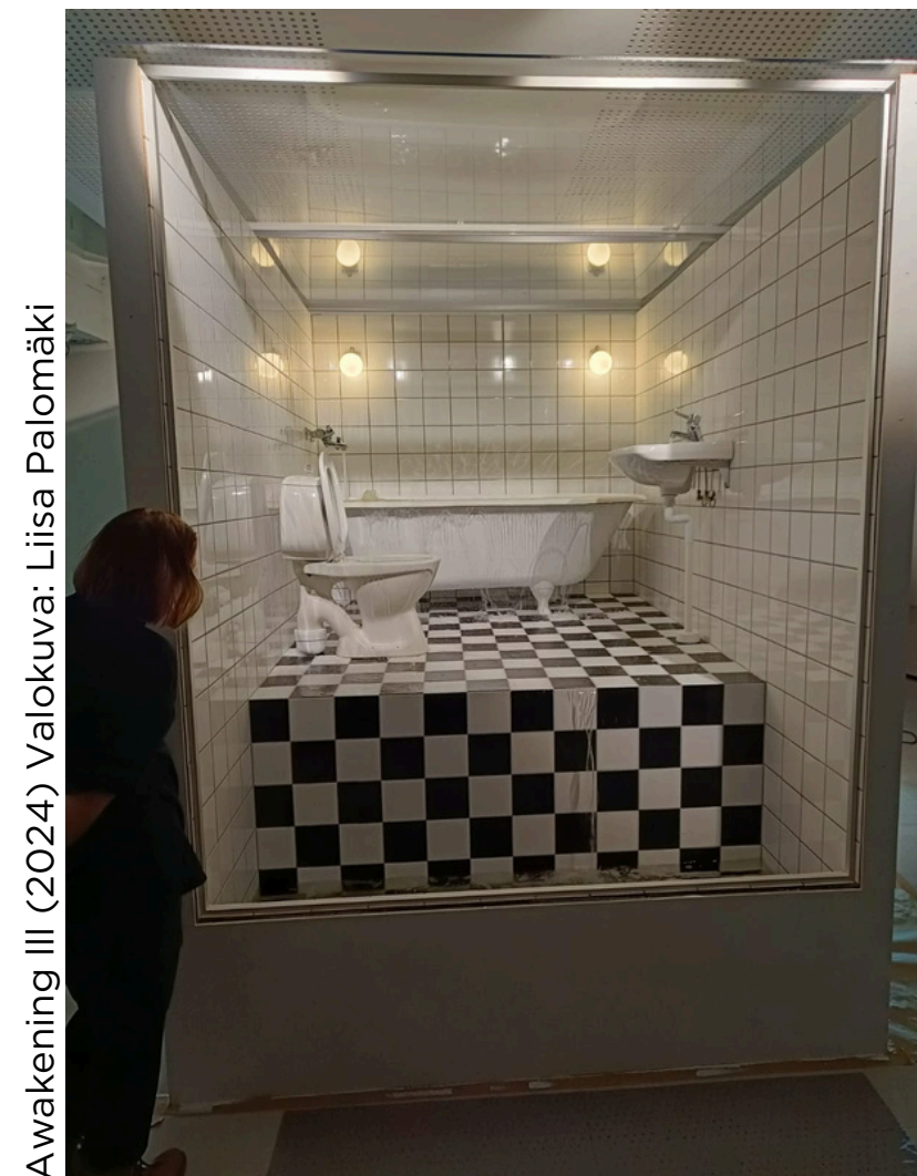
Awakening III (2024)

Hurdan är en konstnär som avbildar sig själv som en koalabjörn? Meta Isæus-Berlins konstnärliga arbete visas i sin helhet under besöket.