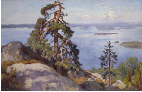
Maisema Koliilta , 1928, öljy kankaalle, 125,5 cm x 196 cm, Ateneumin taidemuseo, Suomen Säästöpankki Oy

Kuinka nykyajan työt eroavat entisajan töistä? Miltä tuntuisi olla koulun sijaan töissä?