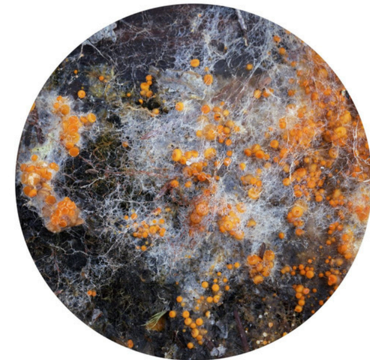
Sanni Seppo, sarjasta Mikrokosmos yksityiskohta, 2022.

2025 alkuvuonna asiantuntijapäivä ja Valokuvataiteilija Sanni Sepon taiteilijatapaaminen