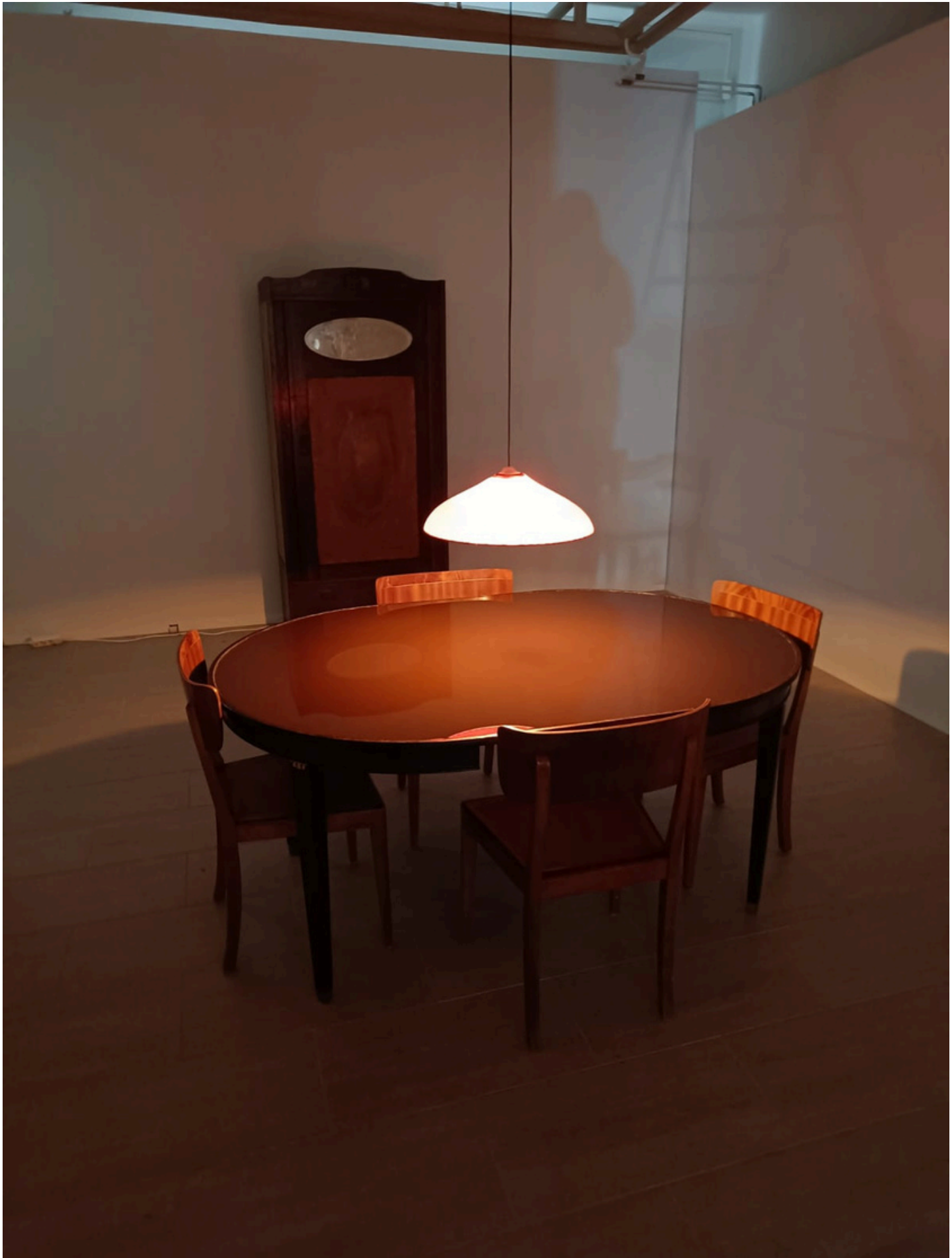
Kunstin modernin taiteen museo, Meta Isaeus-Berlin, Arkadian peilit.