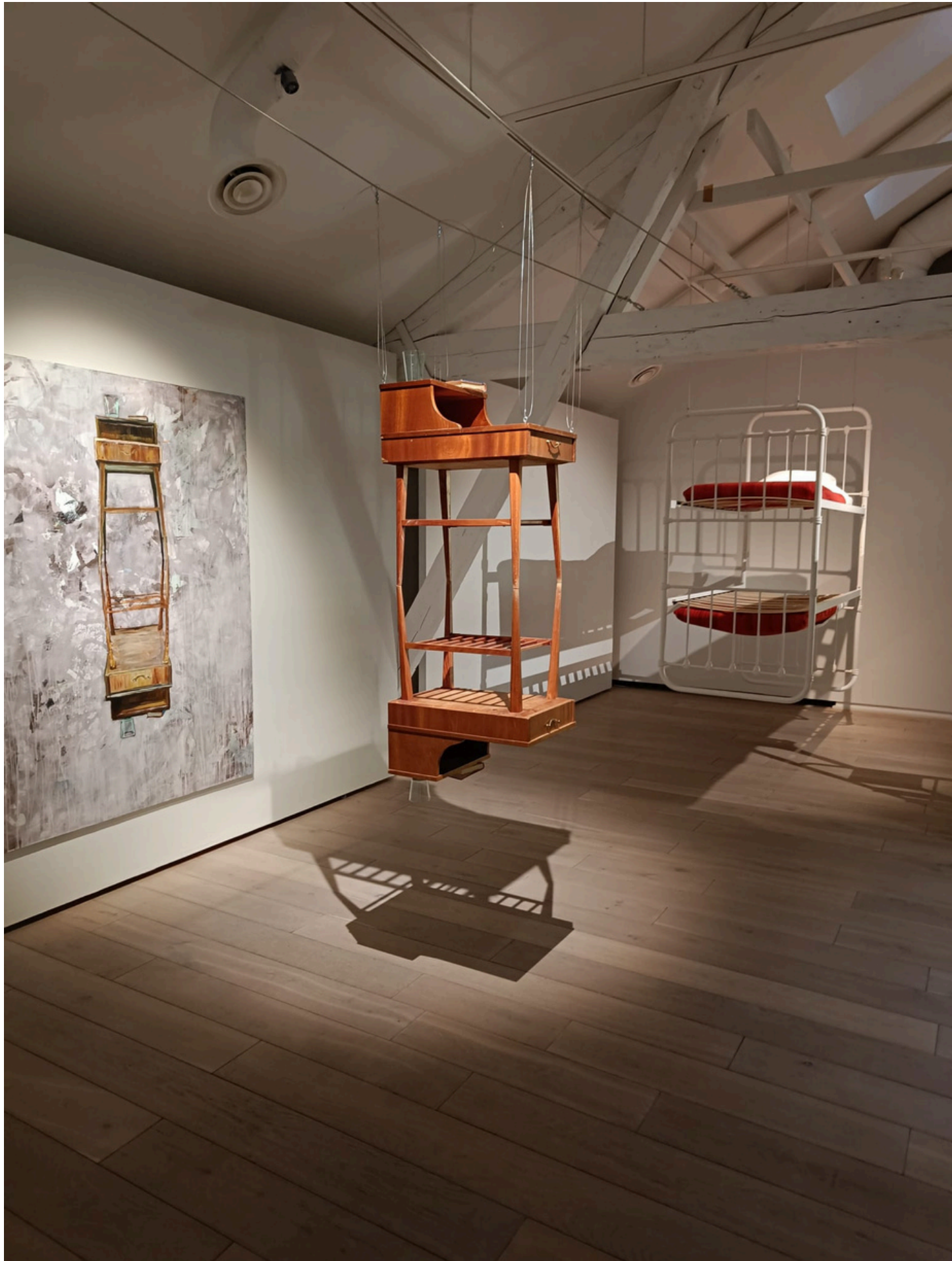
Meta Isaeus-Berlin, Arkadian peilit, Kunstin modernin taiteen museo.