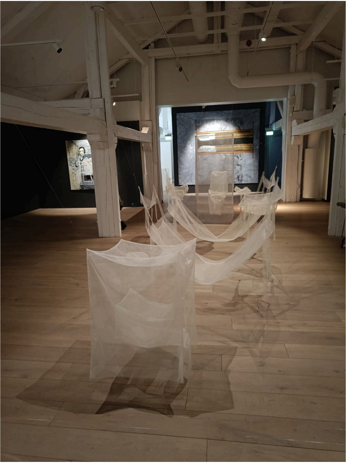
Meta Isaeus-Berlin, Muiston läpinäkyvyys, Kuntsin modernin taiteen museo.