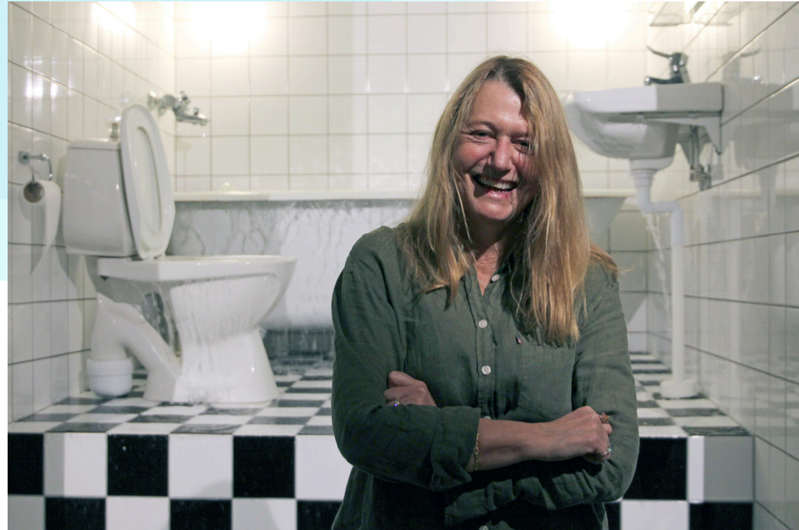
Taustalla installaatio/I bakgrunden installationen Awakening III

Meta Isæus-Berlin (s.1963) on ruotsalainen kansainvälisesti tunnettu nykytaiteilija. Filosofi -näyttely on taitelijan ensimmäinen yksityisnäyttely Suomessa. Filosofi-näyttely on retrospektiivinäyttely eli se esittelee kattavasti Isæus-Berlinin taidetta varhaisemmista teoksista uusimpiin tuotoksiin . Pohtikaa, seuraavaa ennen kuin tulette vierailulle: Mikä esine tuo sinulle turvaa tai mikä esine kuuluu kotiin?