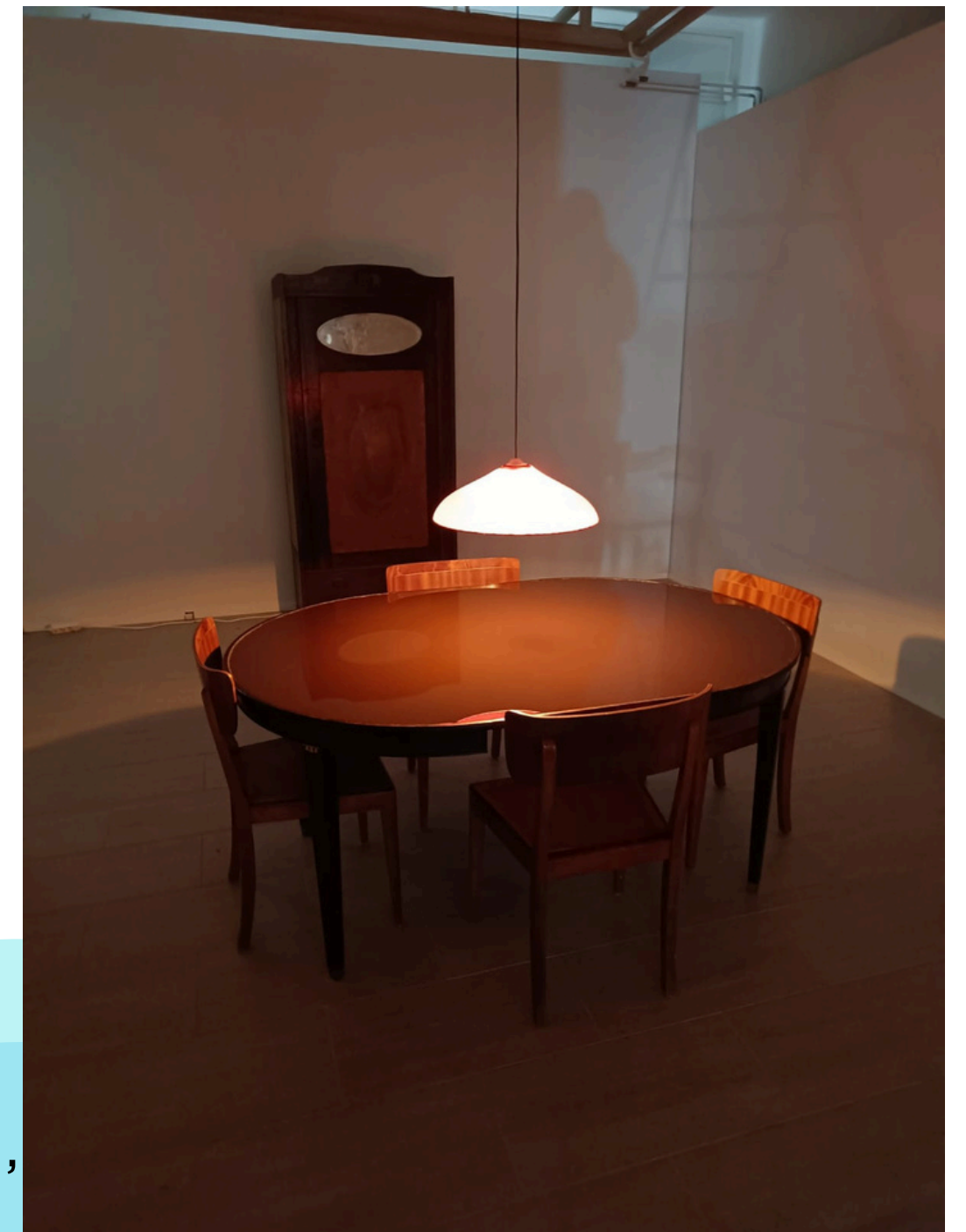
Meta Isæus-Berlin Almost as Usual , 1997, Kuntsin modernin taiteen museo

Jos ehditte, tehkää myös koululaisryhmien kanssa kahoot-visa ennen, kun tulette museonäyttelyyn. Kahoot-visan voi tehdä myös vierailun jälkeen.