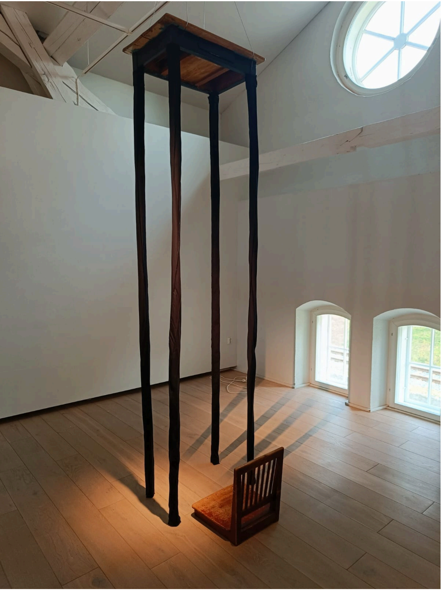
Meta Isaeus-Berlin, Lemmenjuoma, Kuntsin modernin taiteen museo.