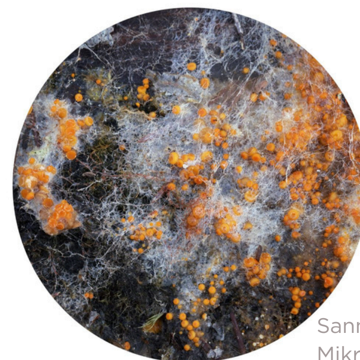
Sanni Seppo, sarjasta Mikrokosmos yksityiskohta, 2022.

I början av år 2025 en expertdag och en konstnärsträff med fotokonstnär Sanni Seppo