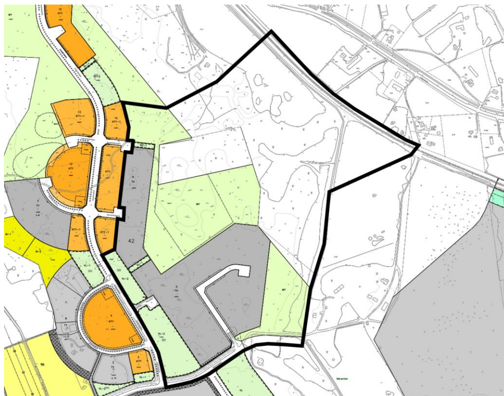
Ote voimassa olevien asemakaavojen yhdistelmäkartasta (ajantasa-asemakaava) ja kaavoitettavan alueen rajaus.