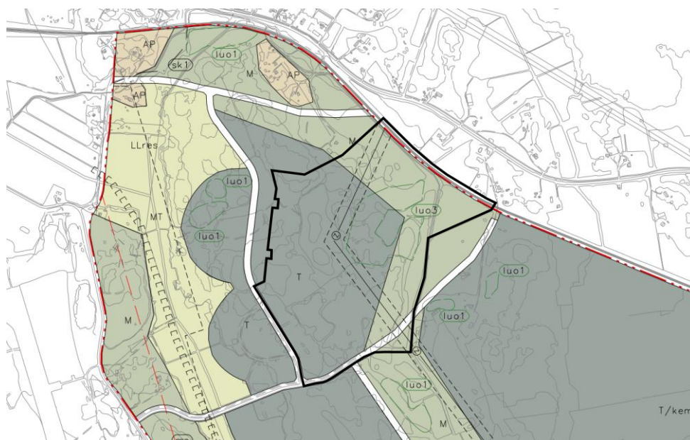
Ote Laajametsän osayleiskaavasta ja asemakaavoitettavan alueen rajaus.

Junaradan osalta voimassa on Vaasan yleiskaava 2030 , jossa alue on osoitettu rautatieliikenteen alueeksi (LR).