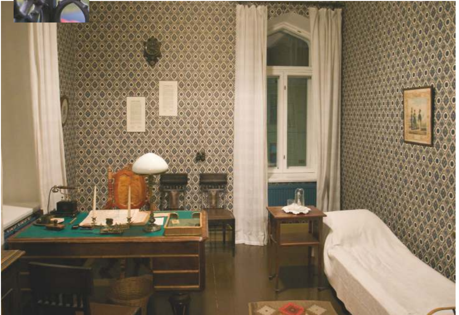
Mannerheimin huone Maaherrantalossa 1918.