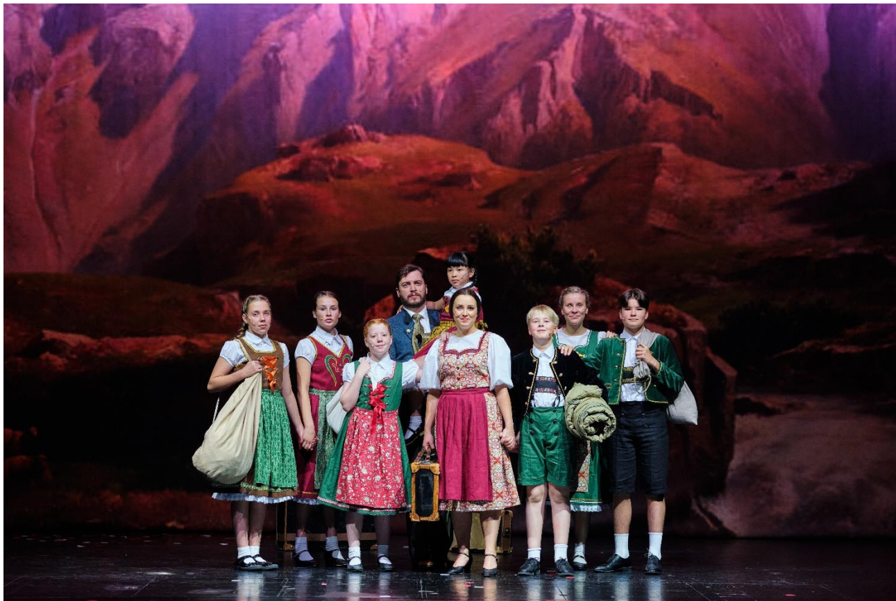
Kuva 7 The Sound of Music (2020).

https://kiva.vsa.vaasa.fi/tukipalvelut/osallistuminenjayhdenvertaisuus/