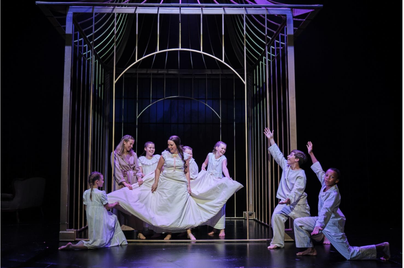
Kuva 3 The Sound Of Music (2021).