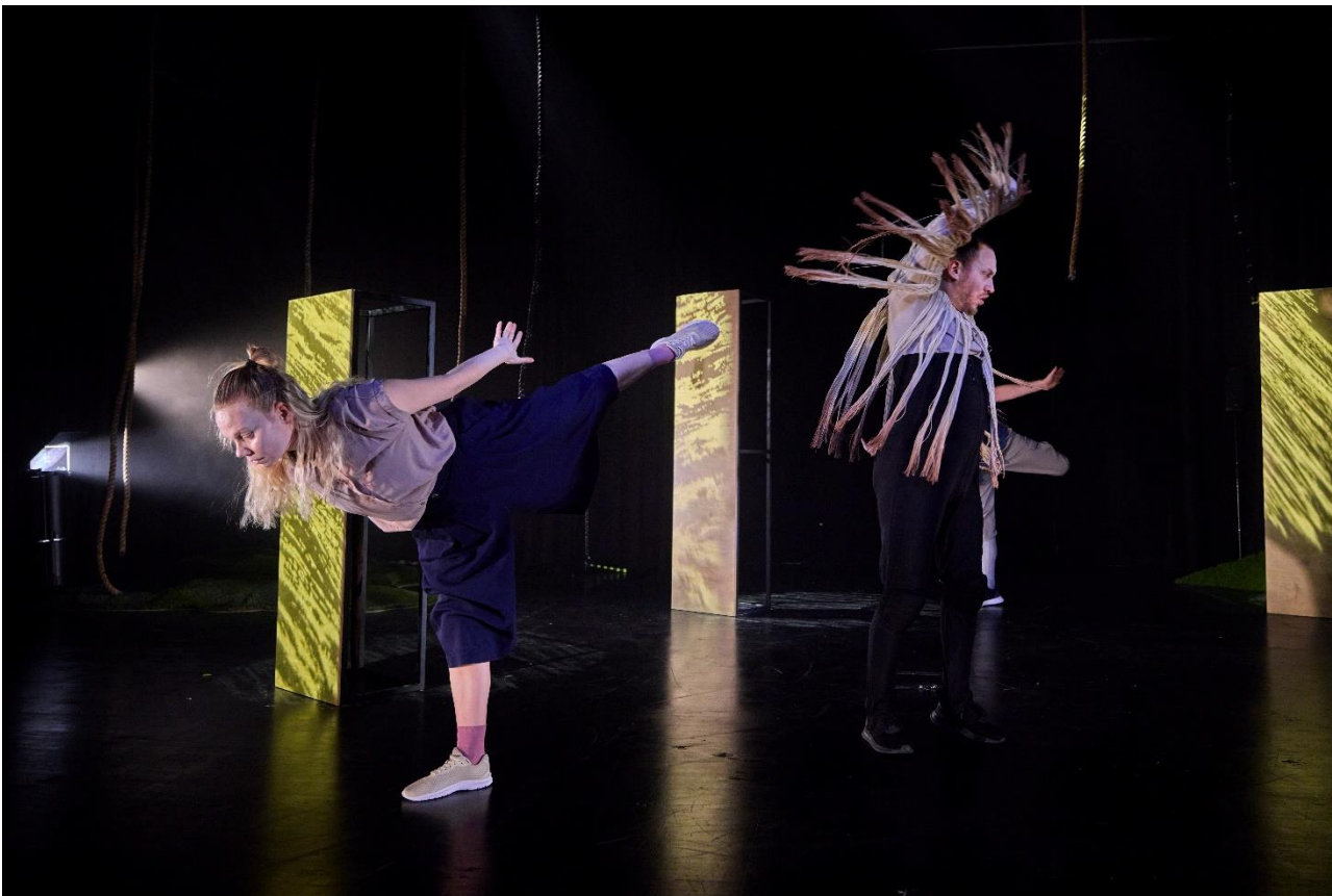
Kuva 5 Koivu ja tähti (2022).