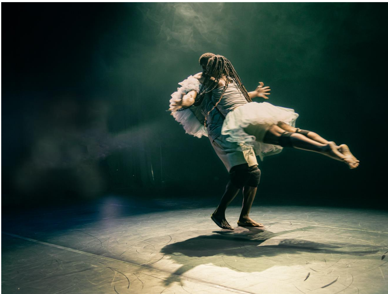
Kuva 6 Maa (2022).