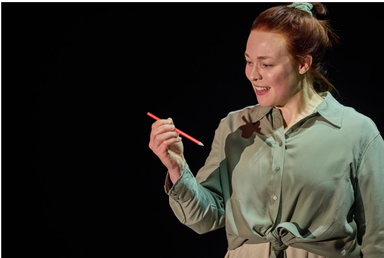
Kuva 4 Fredrika R. (2023).