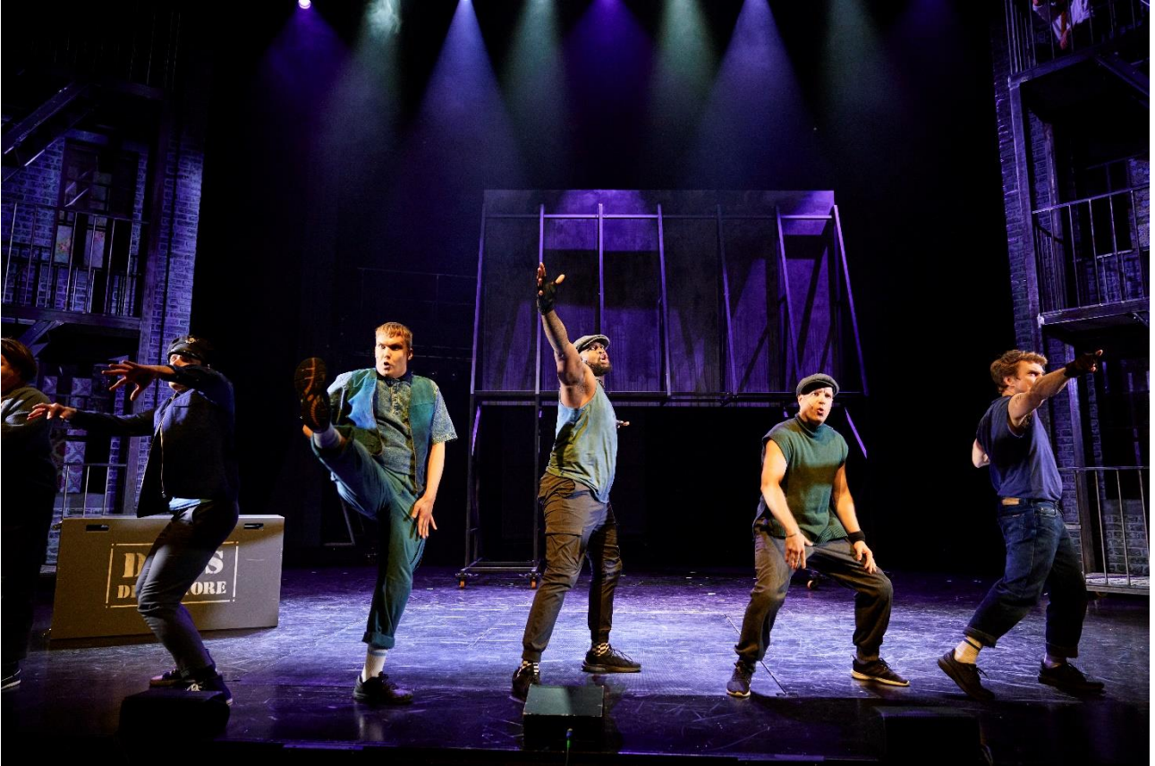
Kuva 2 West Side Story (2022).