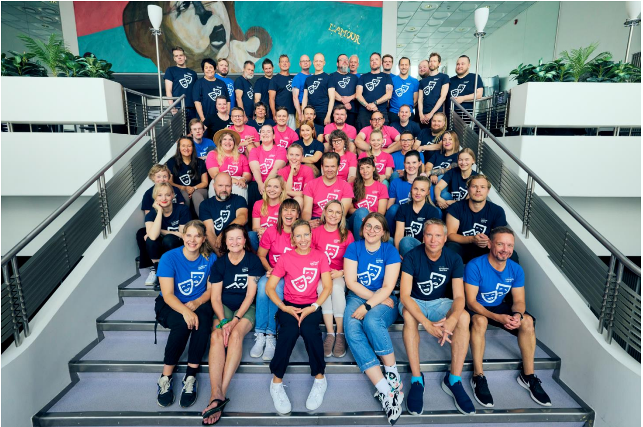
Kuva 1 Henkilökuntakuva (2023).