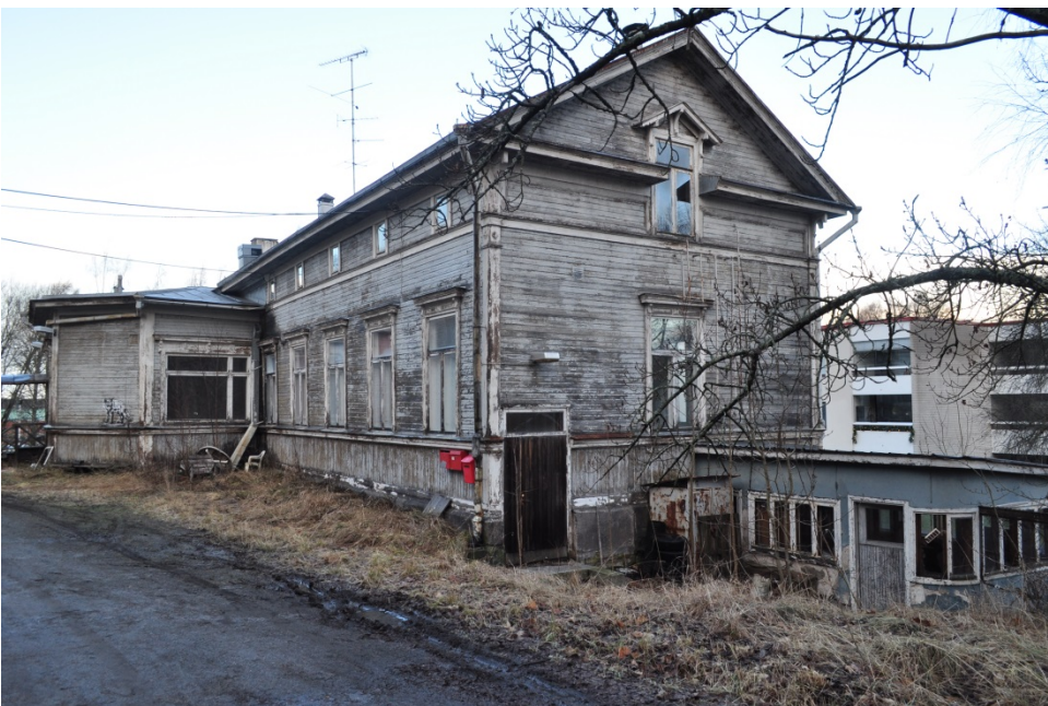
Kuva 12. Entinen konttori-asuinrakennus ja portinvartijan rakennus vuonna 2015.

Alkuperin asuinrakennuksena toiminut rakennus on valmistunut Levoninkadun varteen vuonna 1897. Rakennus toimi pitkään Vaasan Saippuan konttoritiloina ja sen pätyyn rakennettiin tehtaan kulunvalvontaa varten portinvartijan rakennus vuonna 1953 E. Sjöbergin suunnitelmien mukaan. Myöhemmin rakennus on toiminut kahvilana ja nuorisotiloina.