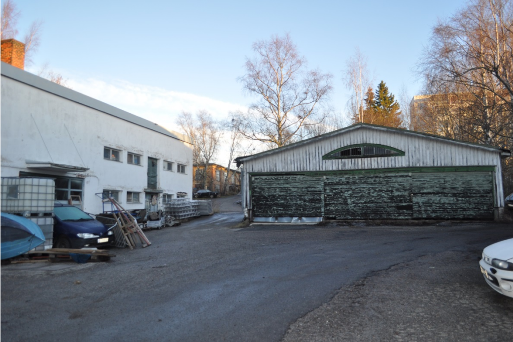
Kuva 9. Rautavarasto.

Puurakenteinen rautavarastorakennus on rankorakenteinen ja betoniperustukselle rakennettu kylmä varastotila. Rakennuksen ulkoasu on tyyliltään enemmän sotia edeltänyttä rakentamista, mutta sitä ei ole esitetty 1930-luvun asemapiirroksissa. Rakennus lienee rakennettu vuonna 1947, mutta on myös mahdollista, että rakennusta on silloin muokattu ja siirretty hieman pohjoisemmaksi.