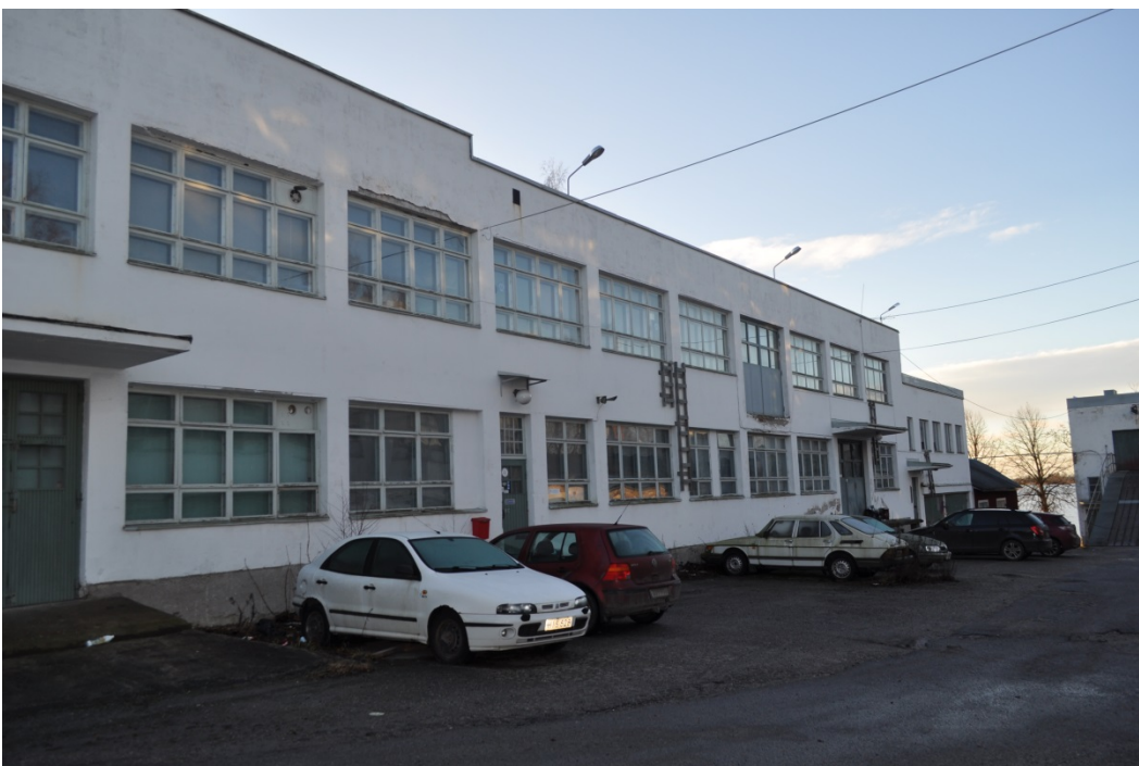
Kuvat 4 ja 5. Uudempi tehdasrakennus pohjoisen puoleiselta sisäpihalta.