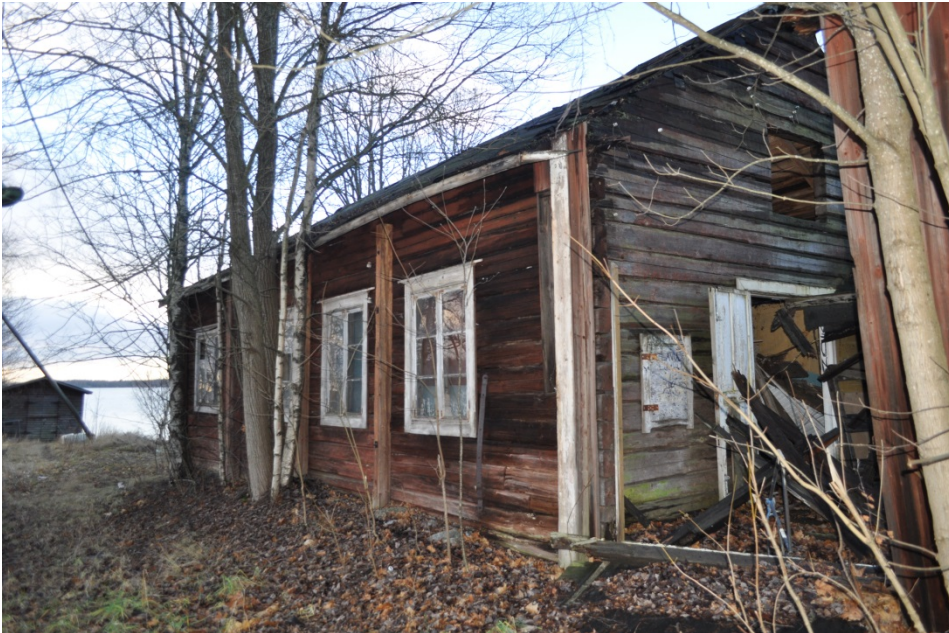
Kuva 19. Pajarakennus marraskuussa 2015.