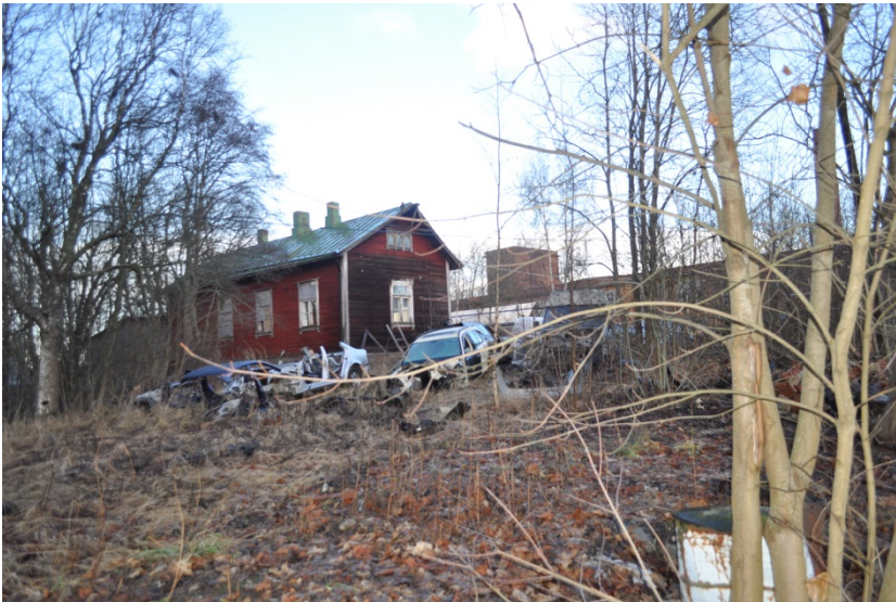
Kuva 15. Luotsiaseman rakennus vuonna 2015.

Luotsiasema Palosaarelle perustettiin jo 1800-luvulla ja uusi hirsirunkoinen luotsiaseman rakennus valmistui vuonna 1900. Luotsiaseman rakennus on säilynyt rungoltaan hyvin alkuperäisenä, joitain muutoksia ulkoasussa on tehty. Rakennukseen myöhemmin liitetty varastokatos on purettu 2000-luvulla.