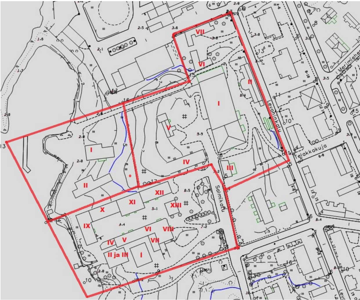
Kartta 1. Inventointialue jaoteltuna Rahkolan, Saippuan ja rannan makasiinien alueisiin.