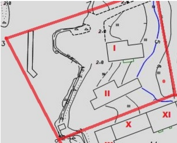
Kartta 4. Saippuan tontin rannan puoleinen osa

Vaasan Saippuan kiinteistöllä eli samalla tonttialueella on tehtaan ja luotsiaseman lisäksi kaksi varasto/makasiinirakennusta. Kohteista ei ole aiempia inventointitietoja eikä arvotusta. Rakennukset sisältyvät valtakunnallisesti arvokkaaseen rakennettuun kulttuuriympäristöön RKY Palosaaren satama-, telakka- ja tehdasalue.