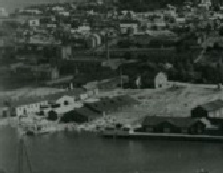
Kuva 2. Teurastamon/Rahkolan kiinteistö 1900-luvun alkupuolella. Tehdas on alkuperäisessä muodossaan ja vieressä kaksi makasiiniriviä, joiden päätyrakennukset ovat säilyneet.