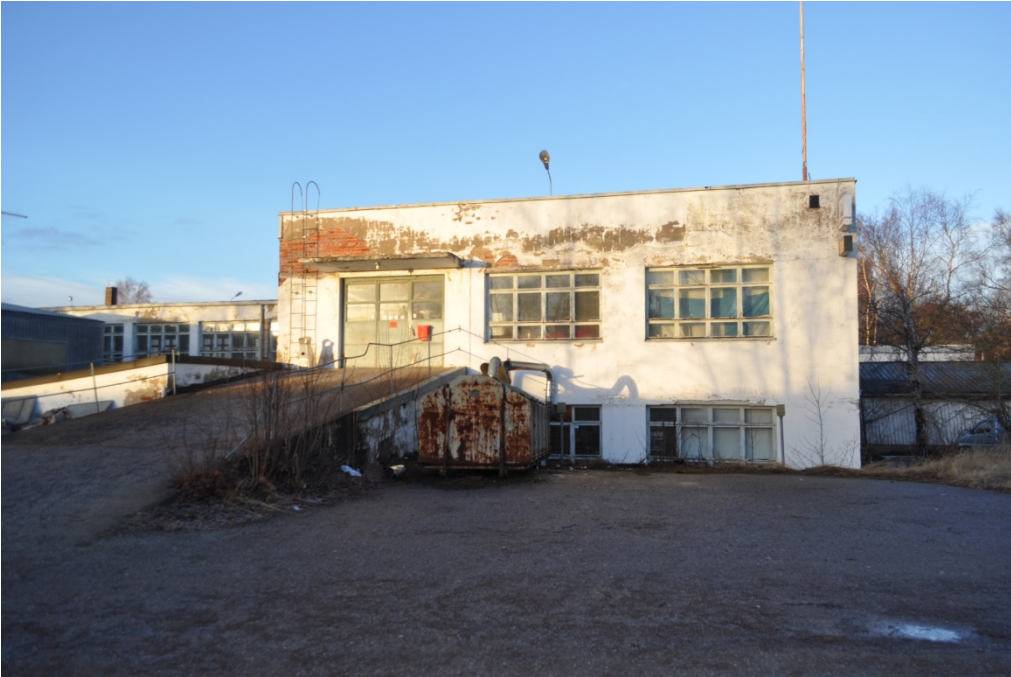
Kuva 6. Tehtaan eteläistä julkisivua.