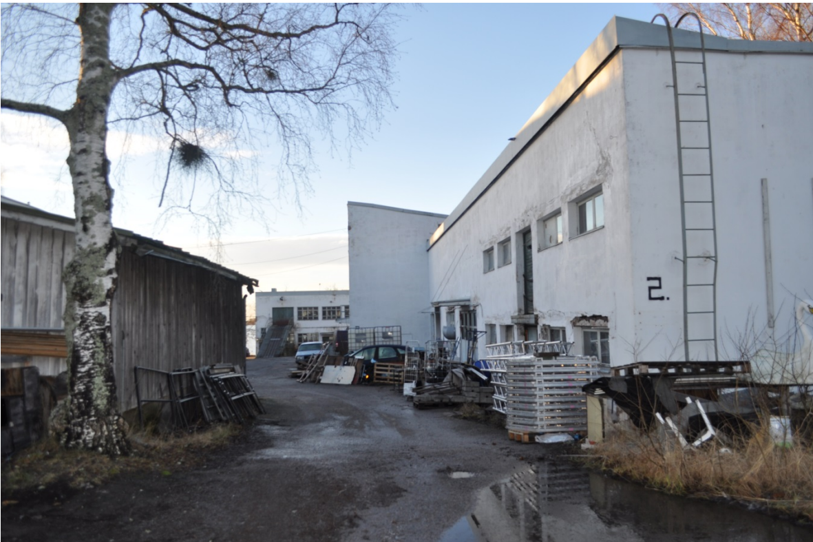
Kuvat 6,7 ja 8. Tontin luoteisivulla sijaitseva tehdasrakennus muodostuu eri-ikäisistä osista. Kuvassa 7 oieva osa on jäljelle jäänyt osa vuonna 1890 rakennetusta sianteurastamon rakennuksesta.