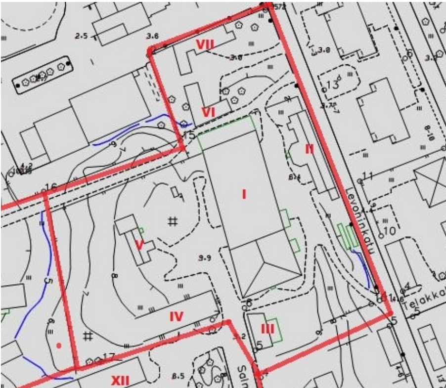
Kartta 3. Saippuan alueen rakennuskanta.