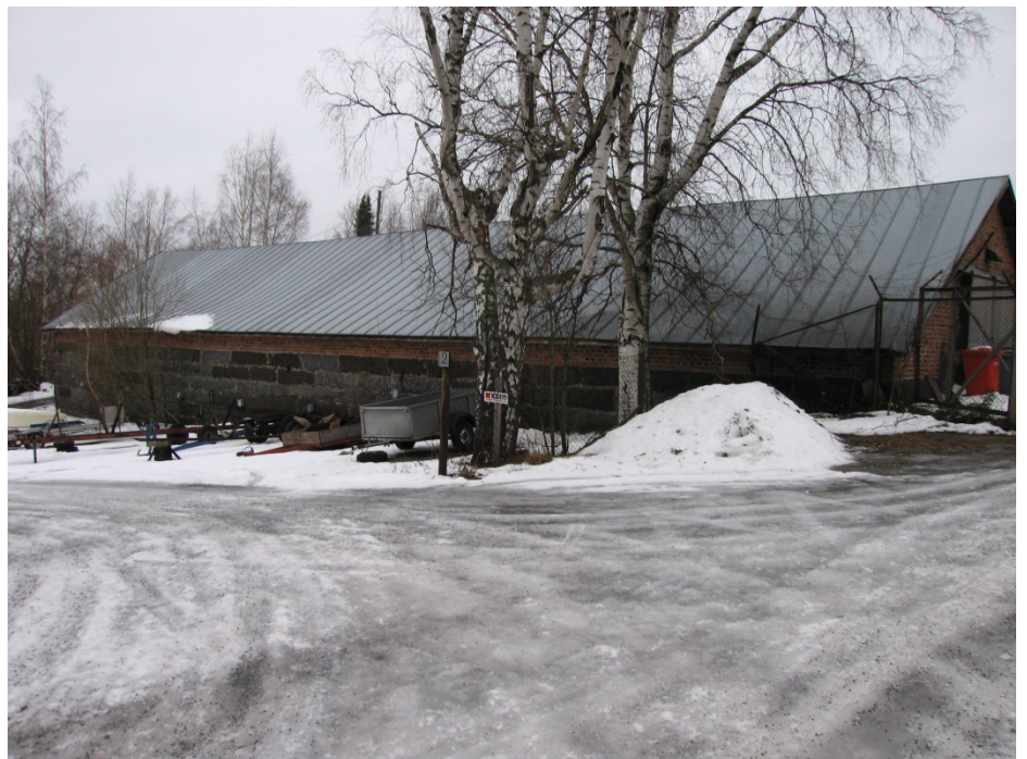
Kuva 14. Makasiinirakennus vuonna 2005.

Kivi-, tiili- ja puurakenteinen makasiinirakennus valmistui Saippuan tehdasalueelle vuonna 1895. Rakennus toimi varastotiloina vielä 1990-luvulla, jolloin sen puurakenteet tuhoutuivat tulipalossa. Rakennuksen kivrakenteiset osat on purettu vain muutama vuosi sitten.