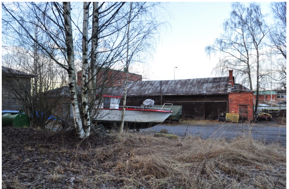
Kuva 17. Varastorakennus Levoninkadulta.

Tehdasalueen pohjoisreunassa sijaitseva puurakenteinen varastorakennus on valmistunut vuonna 1929 mahdollisesti I. Dahlsin suunnitelmien mukaan. Rakennuksessa on hirsirakenteinen leveämpi osa sekä rankorakenteinen varasto ja lisäksi pieni tiilirunkoinen huone Levoninkadun puoleisessa päätyosassa.