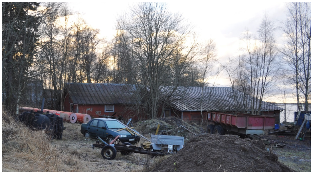
Kuva 18. Venevaja/varasto marraskuussa 2015.

Varasto/makasiinirakennus on ollut Vaasan Saippuatehtaan omistuksessa ja kuuluu edelleen kiinteistölle. Kiinteistörekisterin mukaan makasiini on rakennettu vuonna 1900, mutta rakennus voi olla myös vanhempi. Rakennus melko lailla nykyistä muotoa vastaavana on nähtävillä 1900-luvun ilmakuvissa. Makasiinirakennusta on muokattu useasti sen historian aikana, mutta erityisesti etelänpuoleinen julkisivu on säilyttänyt piirteitä 1900-luvun alkupuolelta.