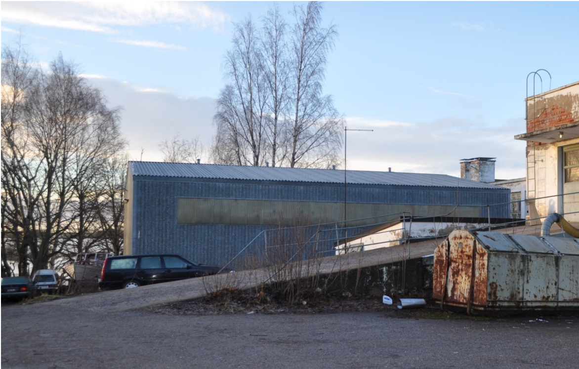
Kuva 1. Varastohalli

Harjakattoinen peltinen varastorakennus on kiinteistön uusin rakennus ja valmistunut vuonna 1980.