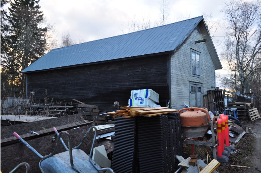
Kuva 13. Varastorakennus on säilynyt ulkoasultaan hyvin.

Rankorakenteinen varastorakennus rakennettiin tehdasrakennuksen laajennuksen yhteydessä tontin eteläreunalle. Vanhat varastot olivat sijainneet laajennusosan paikalla, joten uusi varasto tarvittiin.