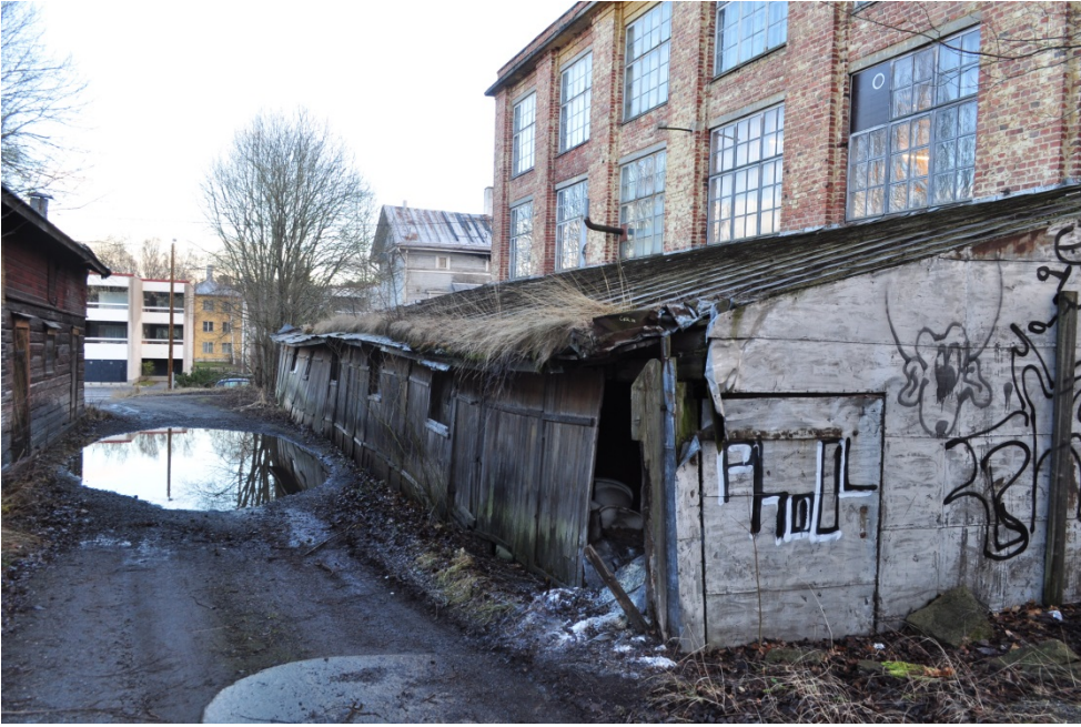
Kuvat 10 ja 11. Vanha saippuan tehdasrakennus vuonna 2015.