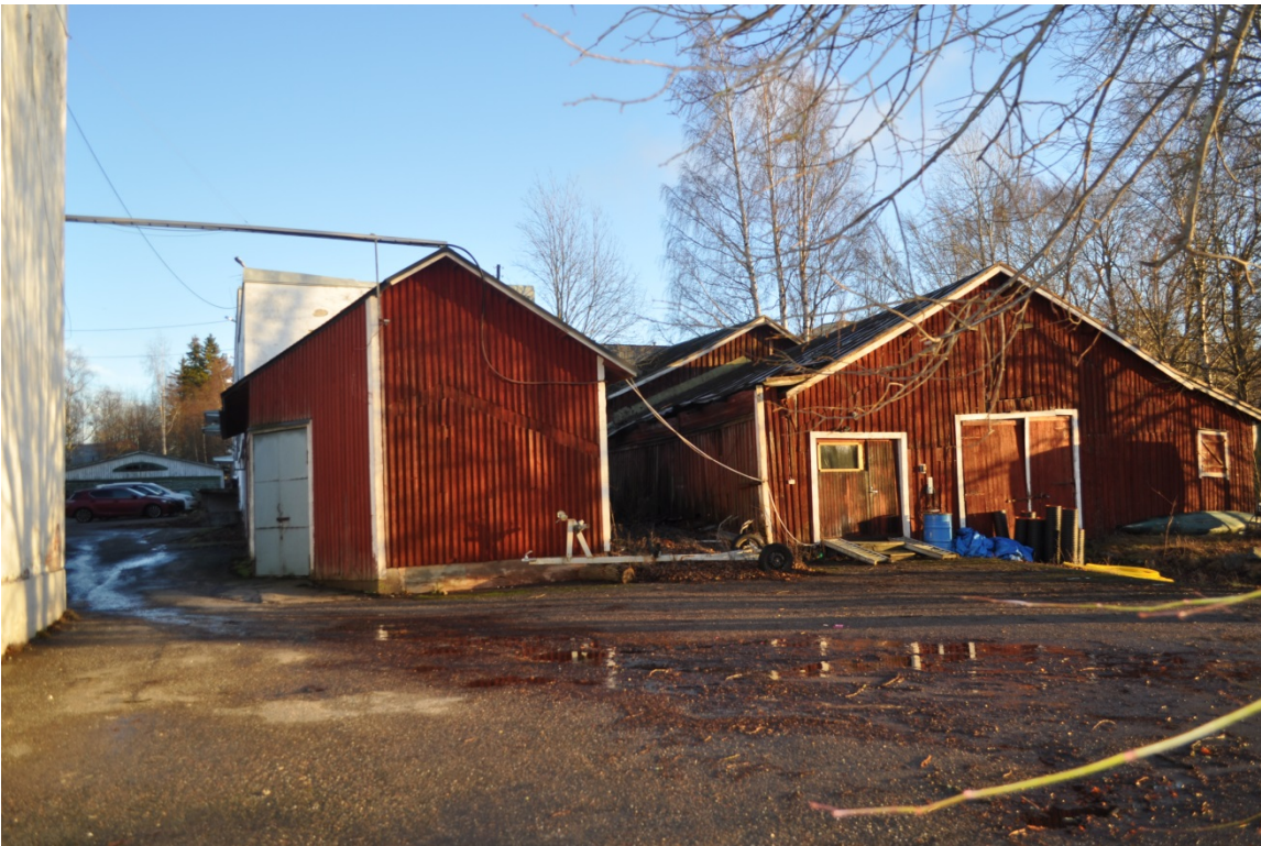
Kuva 3. Oikealla venevaja/varastorakennus II ja III, vasemman puoleinen rakennus on osa IV, joka liittyy kivrakenteiseen tehdasrakennukseen.