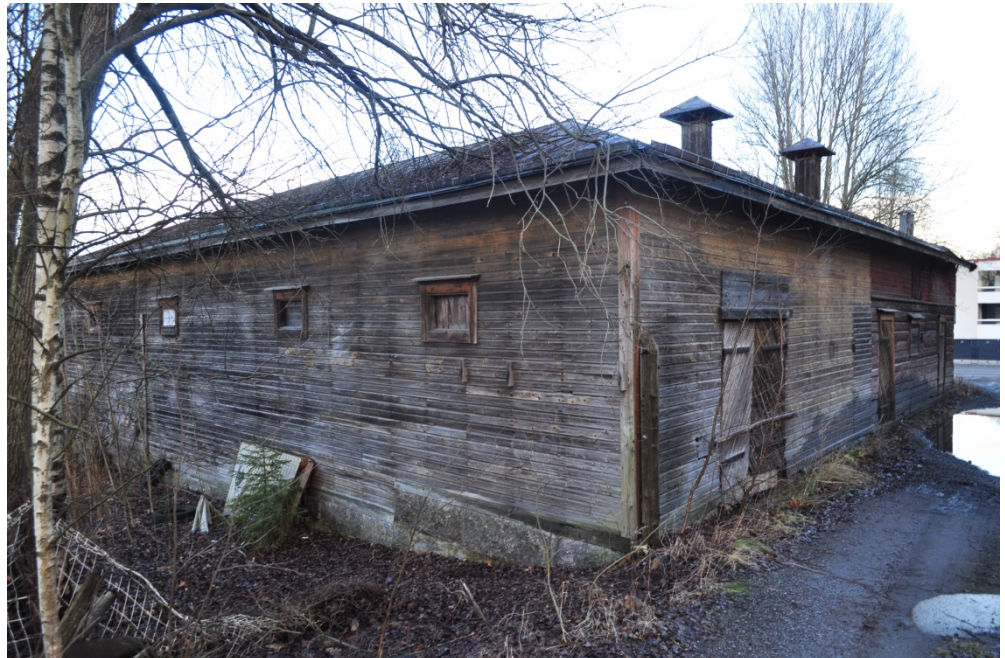
Kuva 16. Varastorakennus rannan suunnasta.