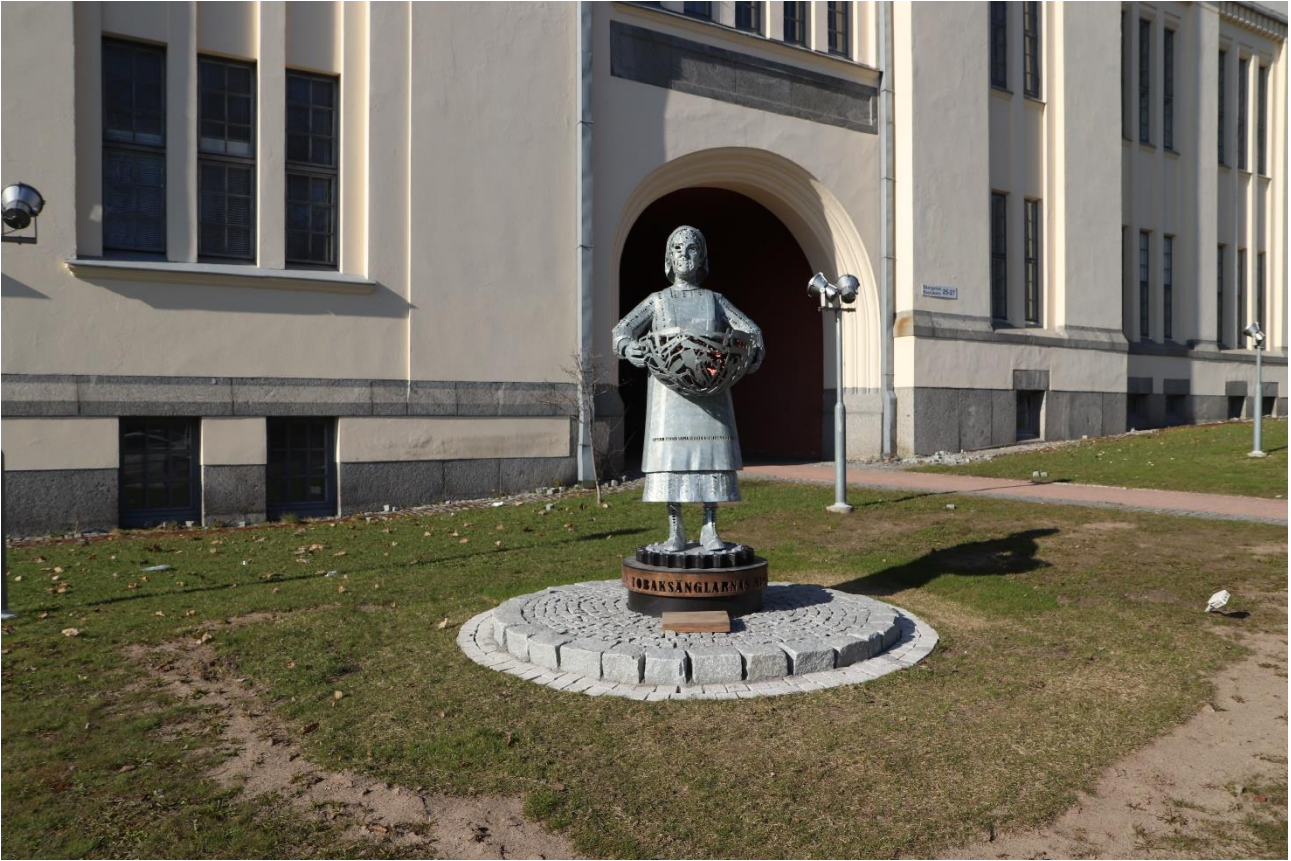
Tiina Torkkeli: Tupakkaenkeli, 2022. Koulukatu 25, Pietarsaari.