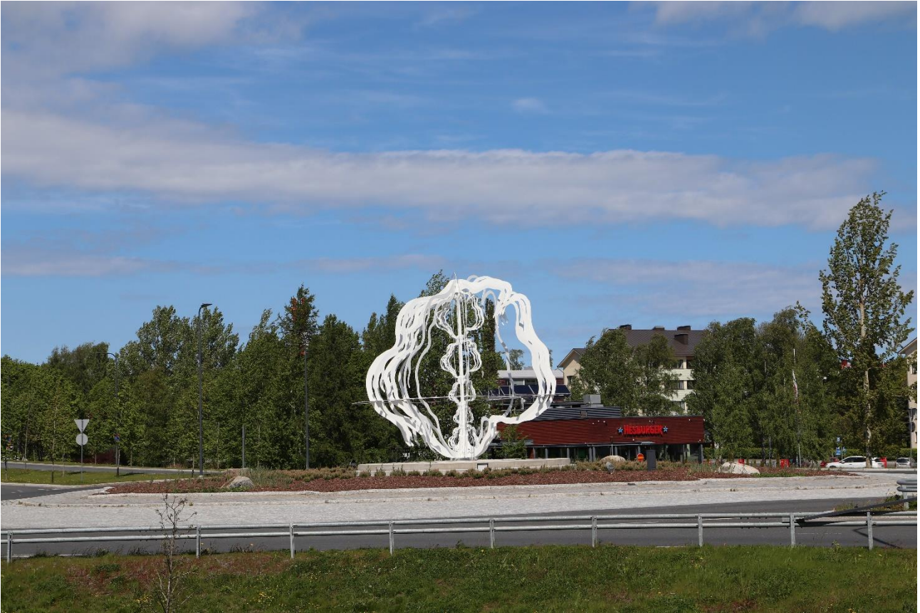
Kirsi Kaulanen: De Geer, 2021. Hietalahden kiertoliittymä, Vaasa.