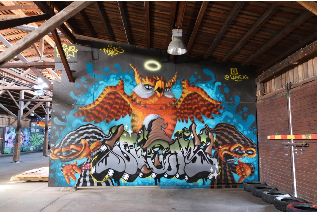
NQK5, 2023. Wasa Graffitilandia, Opistokatu 8, Vaasa.