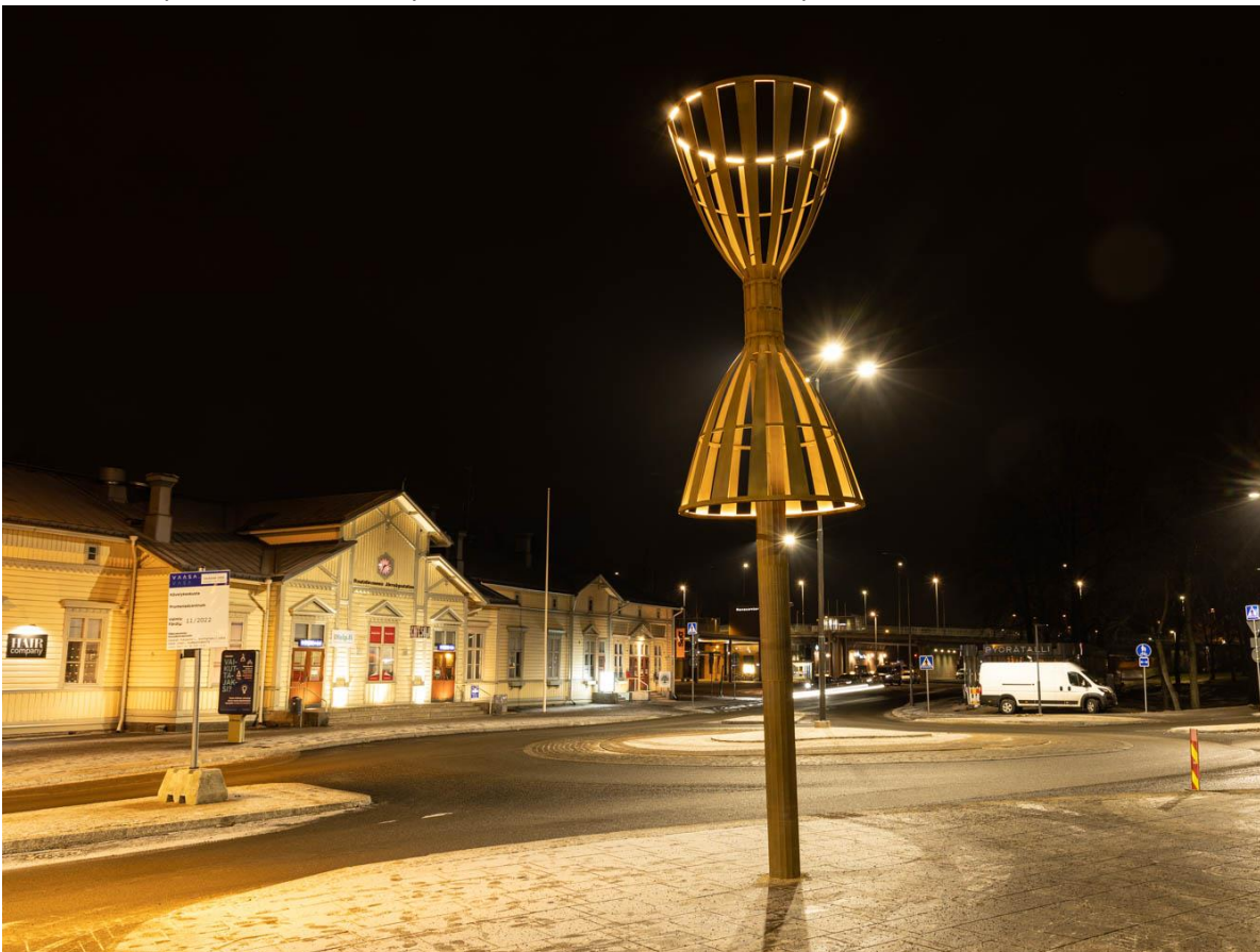
Jaako Pernu: Reimari, 2022. Hovioikeudenpuistikko 23, Vaasa.

Kun teos on pystytetty paikalleen, tilaaja voi järjestää teokselle julkistamistilaisuuden haluamallaan tavalla. Se tekee kaupunkikuvaan ilmestyneen uuden taideteoksen kaupunkilaisille tutuksi.